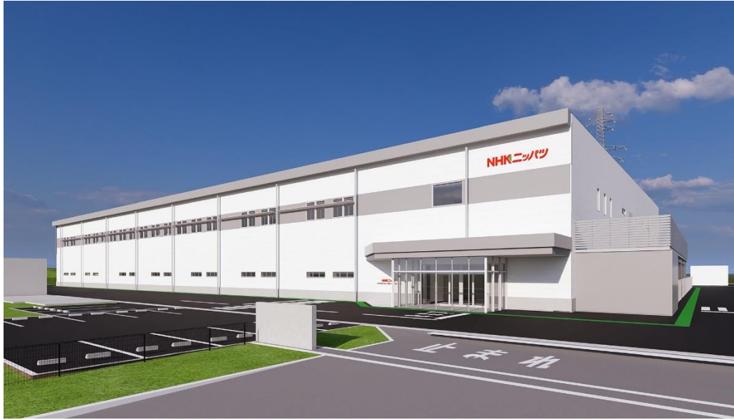
(参考) 産機生産本部駒ヶ根工場 新生産棟の完成予想図